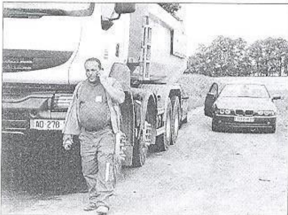
Un véhicule a essayé de forcer le passage malgré la signalisation depuis le Gué-à-Tresmes. Il va être obligé de rebrousser chemin.

Bien que signalée comme barrée, de nombreux automobilistes essaient d'emprunter la route du Gué et pensent pouvoir forcer le passage. Ils sont évidemment obligés de faire demi-tour devant les tran-